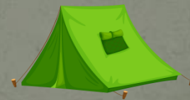
Ночевка в палатке