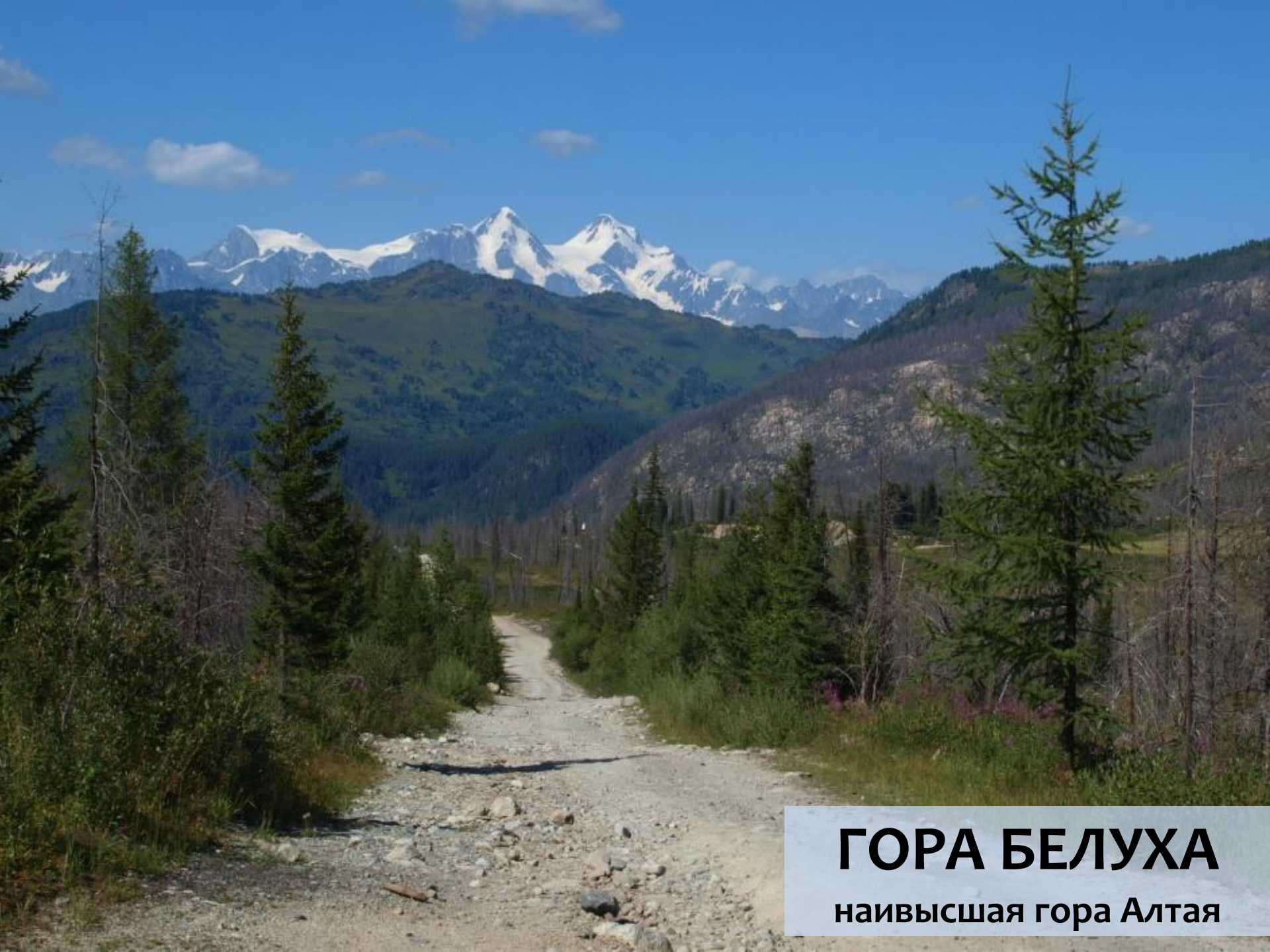
ГОРА БЕЛУХА наивысшая гора Алтая